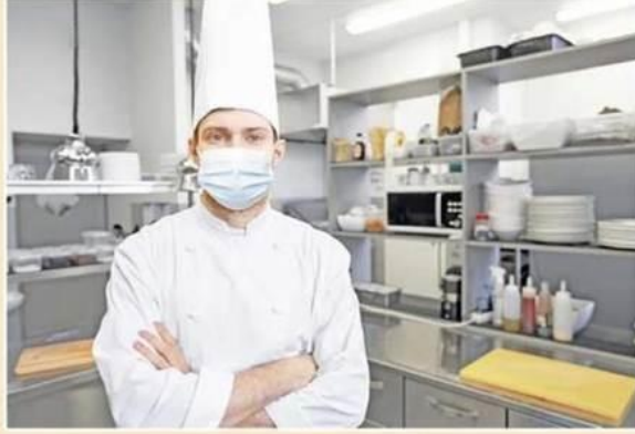
Migros Toptan; Migros Perakende Akademisi ve Türk Armatörler Birliği desteğiyle denizcilik sektöründe gıda güvenliği konusunda bir ilke imza attı.

Migros Toptan, hizmet sunduğu sektörlerin gelişimine katkıda bulunmaya devam ediyor. Migros Perakende Akademisi ve Türk Armatörler Birliği ile birlikte denizcilik sek-